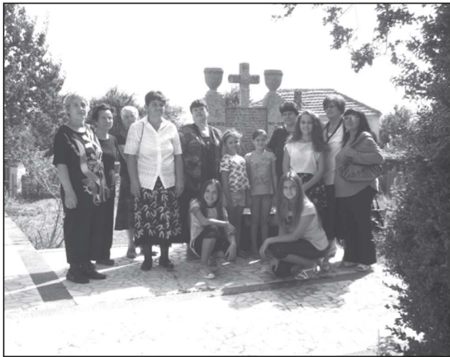
На 6 септември в с. Червенаково отпразнуваха 131-годишнината от Съединението. Бяха поднесени цветя пред паметни плочи в центъра на селото и на чешмата-паметник в църковния двор. Площадът беше огласен от патриотични песни и стихове. Празничната програма беше организирана от читалищното настоятелство

2 септември, VI етап: Мъглиж - Казанлък - Троян, 132 км.