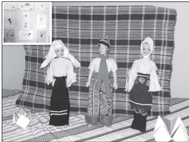
През лятната ваканция децата от Червенаково продължава да посещават читалището и библиотеката - там те изработваха кукли в различни носии, рисуваха, четеха любимите си книги