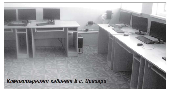
Компютърният кабинет в с. Оризари

ОУ "Никола Прокопиев" - с.Сборище се подготвя за началото на учебната 2016/2017 година. Осигурени са необходимите учебници и учеб-