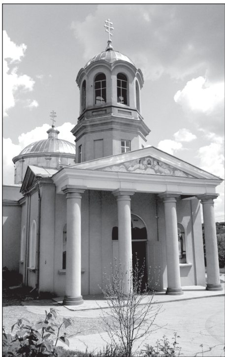
Църквата "Св. Параскева" в молдовска Твърдица, построена през 1842 г.