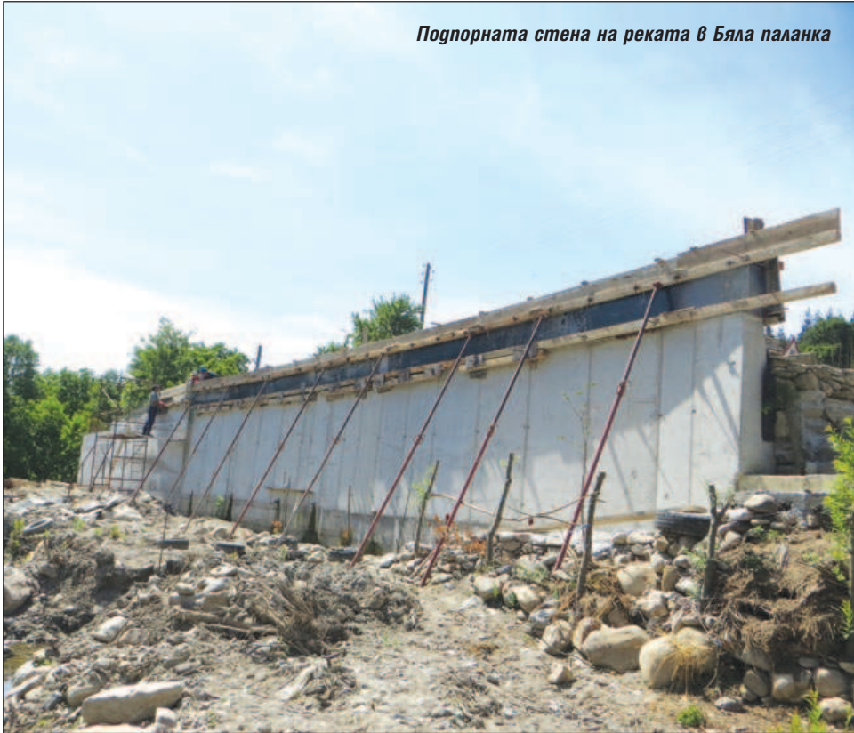
Подпорната стена на реката в Бяла паланка