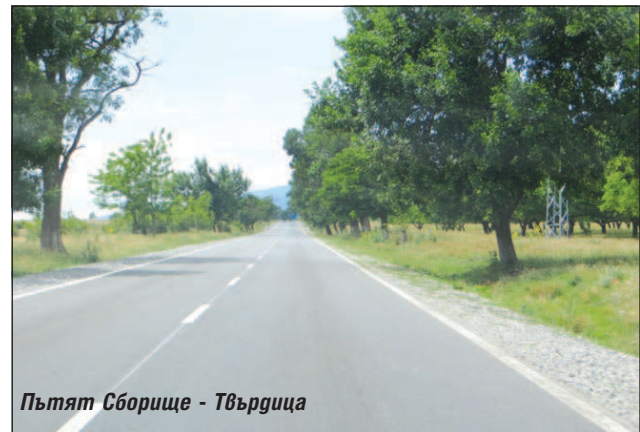
Пътят Сборище - Твърдица