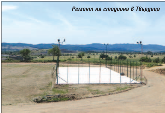
Ремонт на стадиона в Твърдица