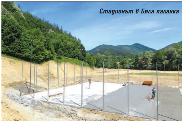
Стадионът в Бяла паланка