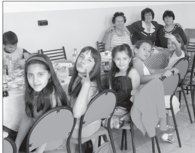
Читалищното настоятелство в Червенаково организира празник за децата в селото.