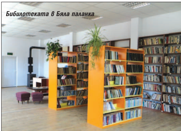
Библиотеката в Бяла паланка