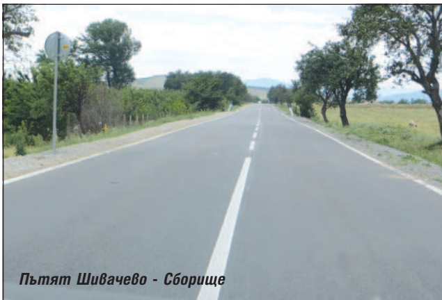
Пътят Шивачево - Сборище