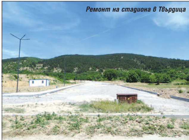
Ремонт на стадиона в Твърдица