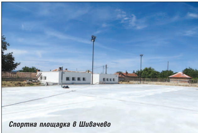
Спортна площадка в Шивачево