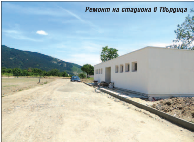
Ремонт на стадиона в Твърдица