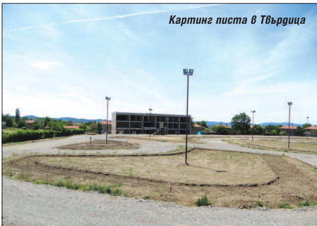
Картинг писта в Твърдица