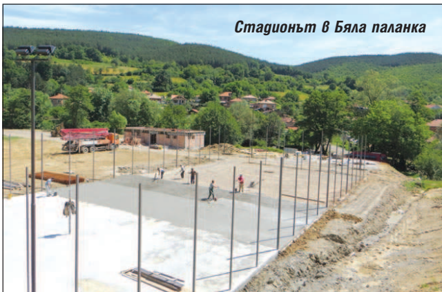
Стадионът в Бяла паланка