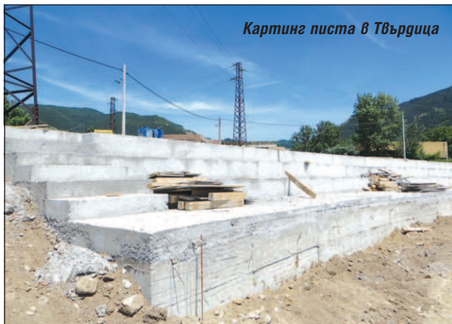
Картинг писта в Твърдица