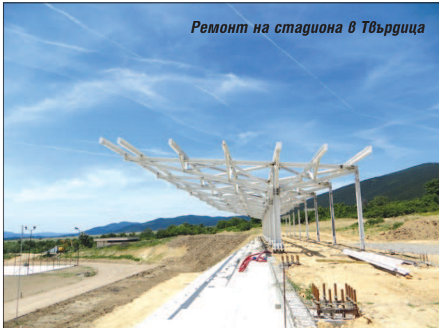
Ремонт на стадиона в Твърдица